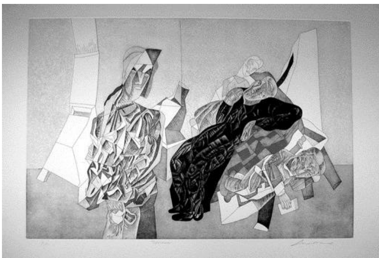
“Teorema 2003”, José Luis Cuevas.